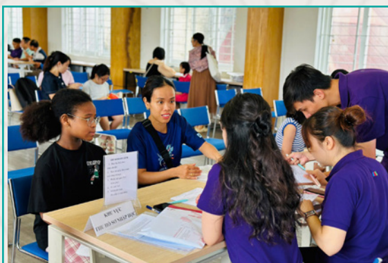
Tổ chức nhập học cho học sinh khóa 7 Trường THCS Ngoại ngữ