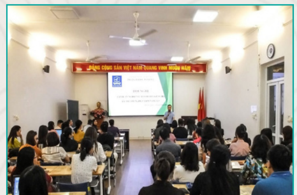
Tập huấn nghiệp vụ thanh tra kiểm tra Kỳ thi Tốt nghiệp THPT 2025 cho cán bộ ULIS