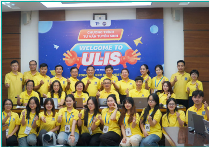
Tổ chức Chương trình Tư vấn Tuyển sinh đại học năm 2025