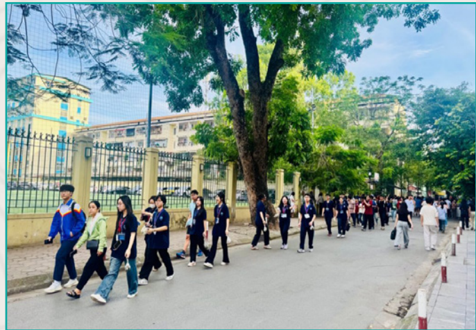
Kỳ thi tuyển sinh vào lớp 10 Trường THPT Chuyên Ngoại ngữ năm 2025