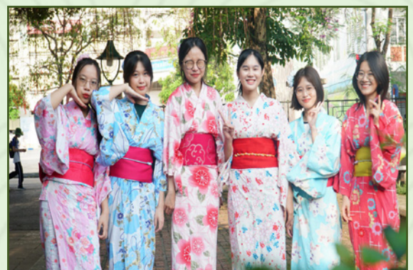
Sinh viên Khoa Nhật trải nghiệm trang phục truyền thống Yukata