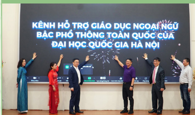
Đoàn Trường Đại học Ngoại ngữ thăm và làm việc với Công ty Samsung Electronics Việt Nam tại Bắc Ninh

Trong khuôn khổ hoạt động của kênh, đến nay đã diễn ra các chương trình: Hội thảo “Dạy-học nhằm phát triển năng lực toàn diện cho học sinh theo chương trình giáo dục phổ thông năm 2018”; khoá học “Thầy cô giáo hạnh phúc”; Tọa đàm “Các nguyên tắc và kỹ thuật biên soạn đề ôn tập thi tốt nghiệp THPT môn tiếng Anh năm 2024” với hàng nghìn giáo viên tham gia.