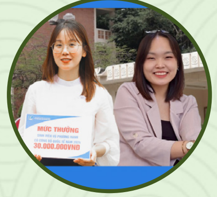
2 ULISer nhận thưởng vì có công bố quốc tế phát triển từ khóa luận tốt nghiệp