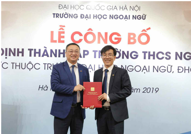
Hiệu trưởng đầu tiên của Trường THCS Ngoại ngữ Nguyễn Phú Chiến